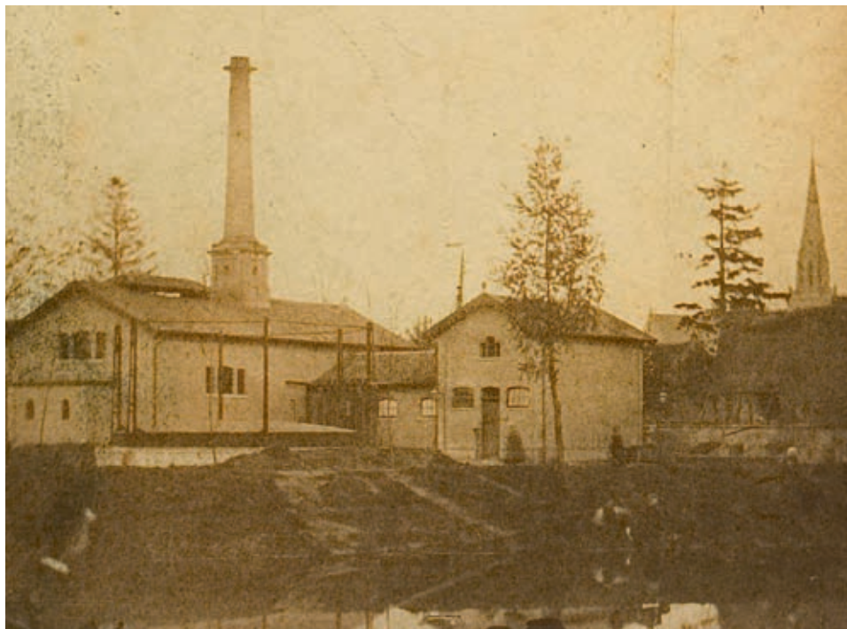
De op 8 november 1862 geopende gasfabriek aan de in 1864 ontstane Gedempte Haven.

Op 3 december kwam de raad opnieuw bijeen om de straatverlichting te bespreken. Besloten werd dat de Helmondse schout en G. van der Loo samen verantwoording zouden dragen voor de 'gemeentelijke lantairnen' en dat deze tijdens de donkere dagen zouden branden 's avonds van vijf tot maximaal elf uur. Tevens werd vastgesteld dat de benodigde olie met de kan zou worden opgehaald en dat 'schutter en nachtroeper Reijnier van Wel' de lantaarns zou opsteken. Verder werden beide heren gemachtigd om de olie 'met het vat te ontbieden' en het loon voor het aansteken 'op de voordeligste wijze doenlijk te