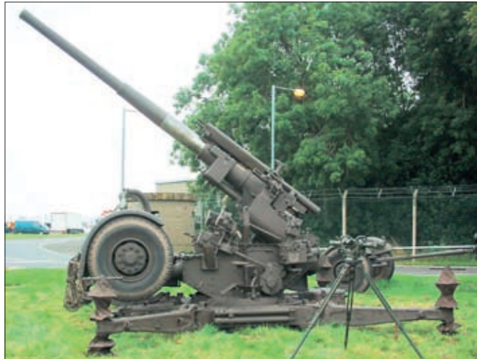
Tijdens de bevrijding lag rond Helmond luchtafweergeschut dat werd bediend door de Britse Landmacht, de Army. Het zware werd gevormd door de 3.7 inch Vickers kanonnen.

naam Rösch. Dit was de eerste maal in de oorlog dat een straalvliegtuig door vuur vanaf de grond werd vernietigd. De Britse inlichtingendienst had grote belangstelling voor het wrak en met name de beide motoren van dit, uiterst moderne, toestel. Vooral omdat dit het