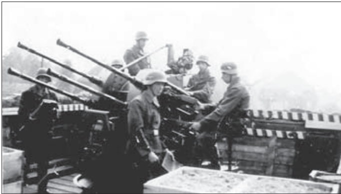
Een 20mm Flak-vierling, die op de Cacaofabriek was geplaatst, speciaal om de planningsstaf van het Soko Fähre in de Molenstraat te beschermen. Het was het enige luchtdoelgeschut dat in de bezetting in Helmond is geweest.

hier, gedurende een dag of tien, geplaatst, opnieuw bevoorrad en getraind om daarna opnieuw te worden doorgezonden naar het front. Ruim een maand na de bevrijding verscheen rond en in de stad het eerste luchtafweergeschut dat was ingedeeld bij de 100 e Anti Aircraft Brigade. Deze brigade van de Royal Artillery, die de luchtverdediging verzorgde tussen Weert en Helmond, stond onder bevel van de Brigadier E.N. Crosse. Ze bestond uit de 90 th en 107 th Heavy Anti Aircraft Regiments en de 113 e en 123 e Light Anti Aircraft Regiments. De lichte luchtafweerregimenten waren uitgerust