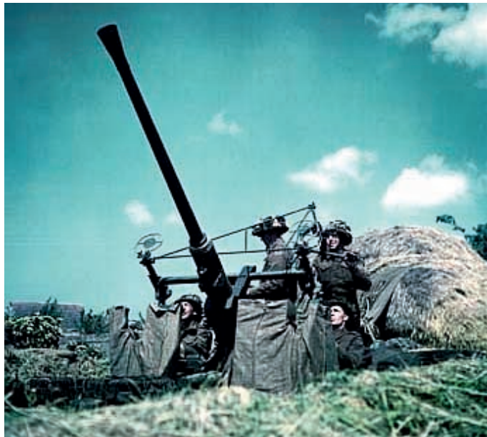
Het lichte geschut werd gevormd door de 40mm Bofors kanonnen. Ook het afweergeschut rond het vliegveld bestond uit 40mm Bofors geschut.

meest complete was dat, tot dan toe, in hun handen was gevallen. Het werd daarom zorgvuldig geborgen en naar Engeland verscheept.