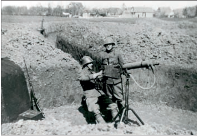
De luchtverdediging van het Stafkwartier van de Lichte Divisie, dat tijdelijk in Helmond verbleef, was opgedragen aan de Negende Compagnie Luchtdoelmitrailleurs. Dit was onder andere uitgerust met de zware M-25 Spandau, watergekoelde mitrailleur.