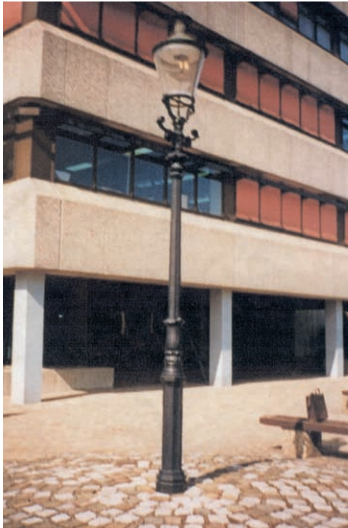
Een oude gaslantaarn stond als klein monument voor het voormalige gebouw van Obragas.

In 1886 besloot de raad de lantaarns in de nacht op zes strategische punten door te laten branden. Buiten de