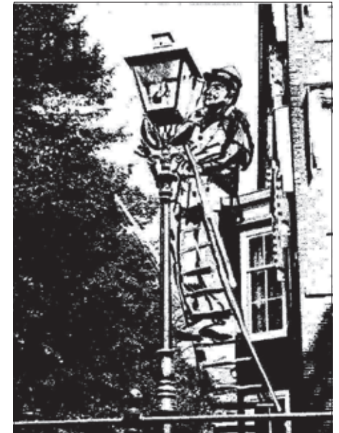
De lantaarnopstekers zorgden ervoor dat de olielampen gevuld en ontstoken werden. Na de introductie van de gaslamp veranderde hun naam in lantaarnverzorger of lampenist. (tekening internet)

Om het gas te ontsteken hadden de lantaarnopstekers een lange stok waaraan boven een vlammetje brandde. Na de komst van het gloeikousje kregen de straatlantaarns een waakvlammetje dat via een hoofdkraan kon worden ontstoken. Deze kraan ging open en dicht via een kettinkje. De lantaarnopstekers hadden nu een stok met een haak waarmee ze het kettinkje konden