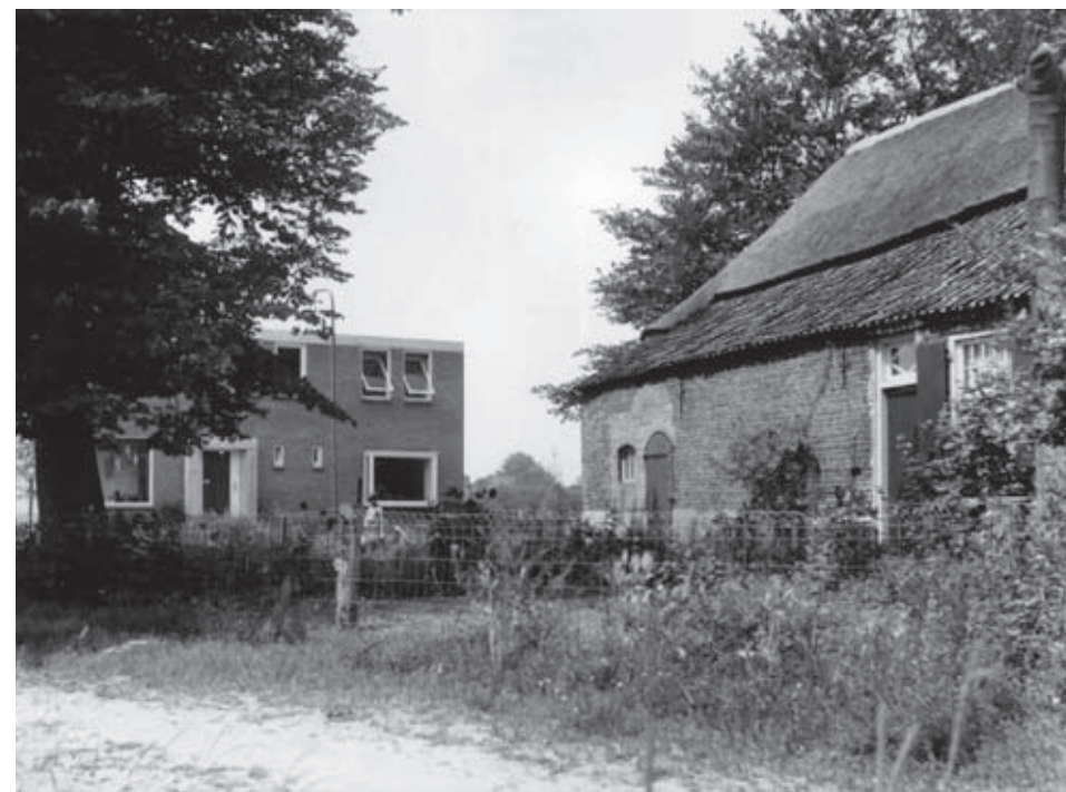
Opname van de Van Nesstraat in 1961. De eeuwenoude boerderij van Van Duynhoven moest kort daarop wijken voor de oprukkende woningbouw.

Lezing door de heer R. Wildekamp met als titel “ Bazi, een geheime Duitse radarpost in de Peel ”. Nadere informatie volgt.