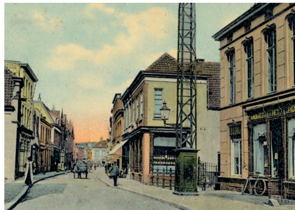
Een mast, vermoedelijk voor telegrafie, in de Veestraat waaraan een lantaarn is bevestigd. De sigarettenwinkel, op de hoek met de Oude Aa, werd in die tijd toepasselijk "Achter het paalke" genoemd.

Nog in datzelfde jaar werd de fabricage van 'twaalf lantairnen' en evenzoveel eikenhouten palen aanbesteedt, waarna de productie werd opgedragen aan de heren Luijben, Sanders en Verhofstadt. Luijben leverde de lantaarns, geheel volgens model, voor 84 gulden. De productie van